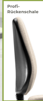
Abb. in Stoffgruppe 1, 111 Hellgrün mit XL Alu-FK [59-1]