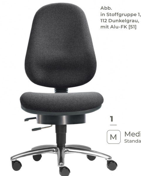
Abb. in Stoffgruppe 1, 112 Dunkelgrau, mit Alu-FK [51]